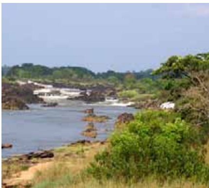
Gîte de reproduction typique de la mouche noire dans l'eau à courant rapide